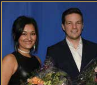
ÅRETS TVÅÅRING Claustrophobic