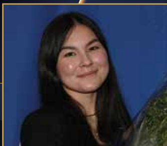
ÅRETS PONNY KAT A Scarlet