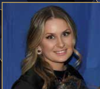
ÅRETS PONNY KAT B Mirage