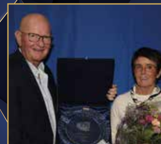
ÅRETS HÄSTÄGARE KB Capulus Horses