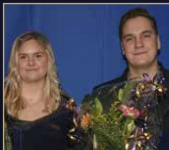
ÅRETS STO Sabasi