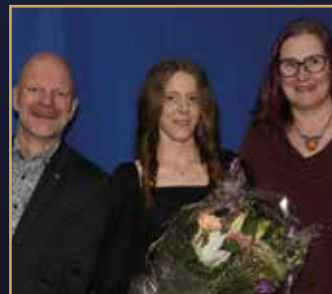
ÅRETS FYRÅRING & HÄST Bicc's Tobee