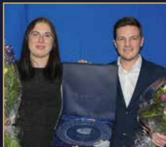
ÅRETS TREÅRING Limoncello Boko