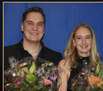
ÅRETS KALLBLOD Fakserling